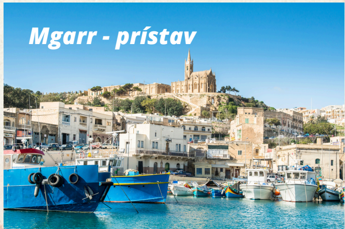
Mgarr - prístav